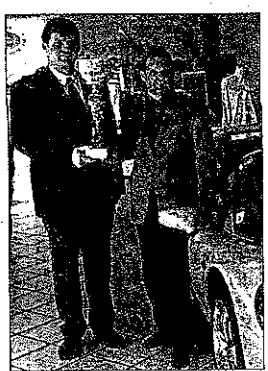
Renault Himmetsberger ist der Hauptsponsor.

Spielen am Mittwoch, 8.11., die Finanzbediensteten der FLD Wien, NÖ und dem Burgenland um Meistertiteln, so steht am Donnerstag und Freitag (9.-10.11.) die Bundesmeisterschaft der „Finanzler“ auf dem Programm.