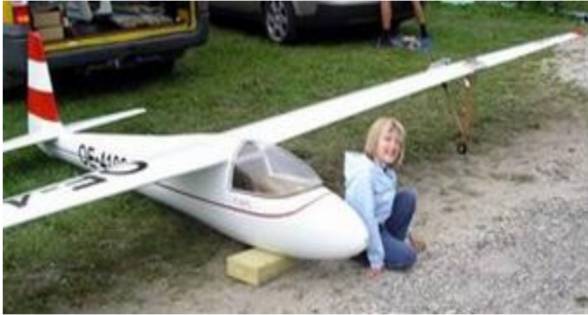
..richtig Große Brummer...