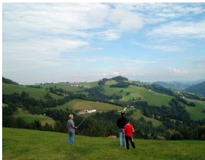
2km/h Wind am Osthang....

Nachfolgend ein paar Fotos von diesem wirklich strahlend schönen Nachmittag.