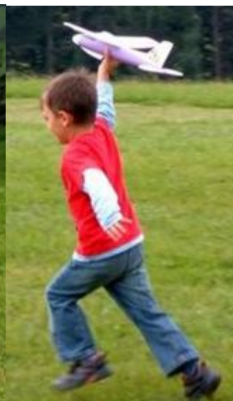
...fröhliche Kinder (Große und Kleine)...