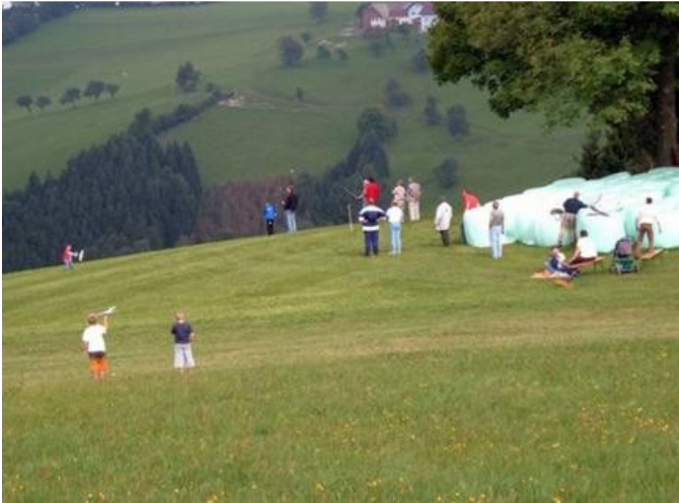
... dann 2,5km/h am Westhang...