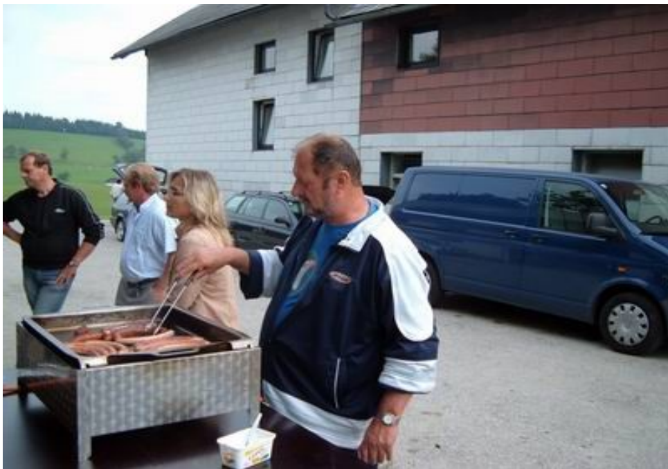
.. zum Glück gab es auch Würstel...